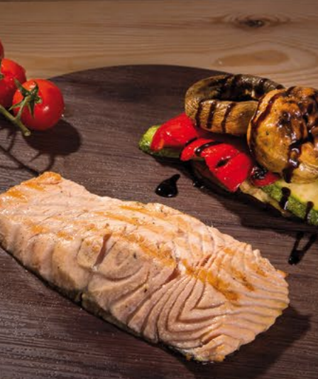
Σολομός σχάρας με ψητά λαχανικά