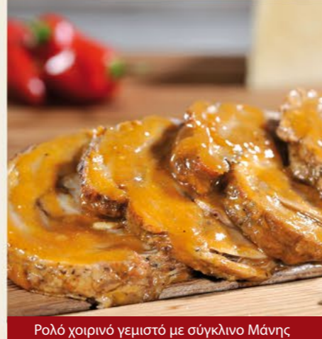
Ρολό χοιρινό γεμιστό με σύγκλινο Μάνης