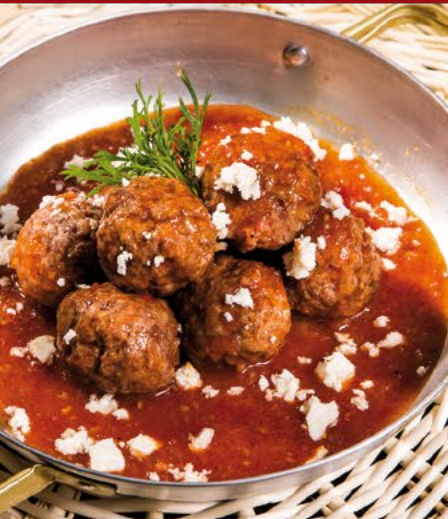
Κεφτεδάκια με σάλτσα ντομάτας & τριμμένη φέτα

Όλα μας τα κρέατα είναι φρέσκα και οι κιμάδες χειροποίητοι .